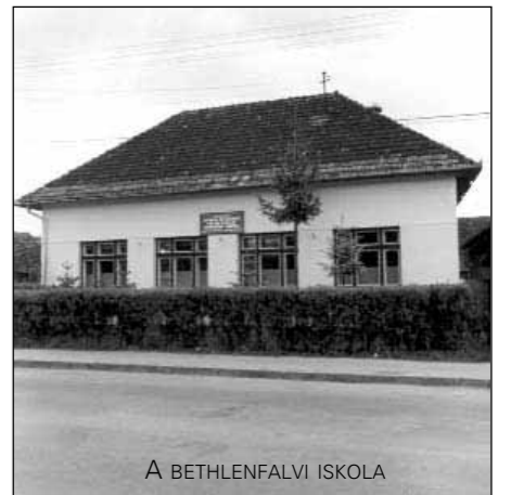
A BETHLENFALVI ISKOLA

A sok szeretettől és hálától csillogó gyermekszem biztosított arról, hogy pályámat nyugodt lelkiismerettel fejezhetem be.