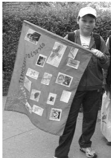
(tallózás a csapatok beszámolóiból)

... Csütörtök reggel 9 órakor indultunk a vetélkedő gyakorlati szakaszára. Az idő nekünk kedvezett. Az iskola udvarán gyülekeztünk, feltűztük a jelvényeket a zászlóra, majd miután meghallgattuk tanáraink hasznos tanácsait útnak indultunk.