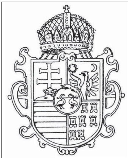
Bethlen Gábor címere