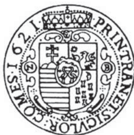
Bethlen Gábor tallérja 1621-ből