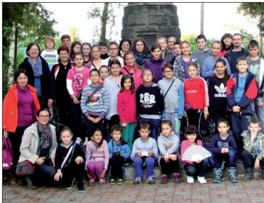
Jutalomkirándulás a Bethlen Gábor Általános Iskolából

Az indulásunk a C+C parkolójából kezdődött. Az első megállónk a Petőfi körtefája volt, ahol még megnéztük Petőfi és Bem szobrát Székelykeresztúron. Tovább menve a következő megállónk a Bethlen kastély volt, ahol még megnéztük a Bethlen család címerét Keresden. Még tovább haladva megérkeztünk Berethalomba, ahol megnéztük a híres ol-tárt, Berethalom templomát és a tizenkilenc zárral ellátott ajtót, na még Berethalomban megnéztük a hajdani Püspöki templomot vagyis a (Birnhalm-ot) ahol képeket is vásárolhattunk. Végül hazafelé tartva megálltunk a kóhalmi várnál és felmentünk a leg-leg tetejébe. Hazafelé tartva újból a C+C parkolójában álltunk meg.